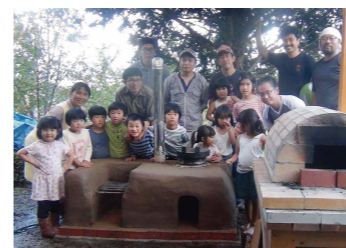
地域を結ぶ交流の場「里山かまどの庭」（2017年）