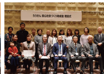
ろうきん安心社会づくり助成金 贈呈式（2018年）