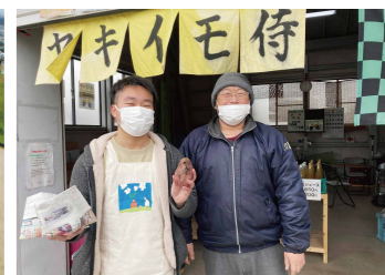
若者の社会復帰スタートアッププロジェクト(2020年)