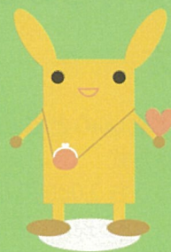
長野県みらいベース キャラクター Kiffy（キッフィー）

子どもたちへ あなたがそこにいること、その笑顔、一生懸命取り 組む姿、すべてにありがとう。未来を担う子どもた ちが、将来に夢と希望を持ちのびのびと育つように、 お父さん、お母さんを支え、子どもたち自身の力を 信じ、その育ちをみんなで支えていく、そんな長野 県を目指していきます。